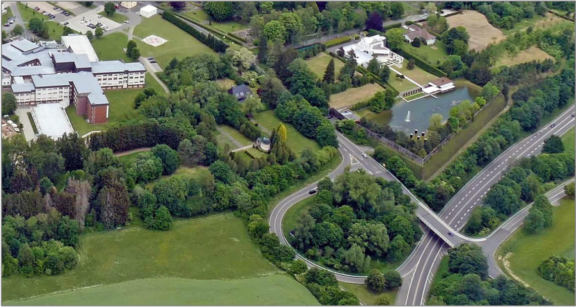
Luftaufnahme Rötter 2022.

Nun ist die „Stifterkapelle“ dem Erdboden gleichgemacht. Auch wenn sie nicht formal als Kulturdenkmal geschützt war, so war sie doch als solches zu betrachten.